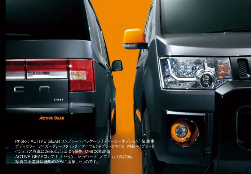
Photo : ACTIVE GEARコンプリートパッケージ (ディーラーオプション) 装着車 ボディカラー : アイガーグレーメタリック / ダイヤモンドブラックマイカ 内装色 : ブラック インテリア写真はカットボディによる撮影 (MMCS非装備) ACTIVE GEARコンプリートパッケージ (ディーラーオプション) 非装備。 写真の小道具は撮影のために用意したものです。