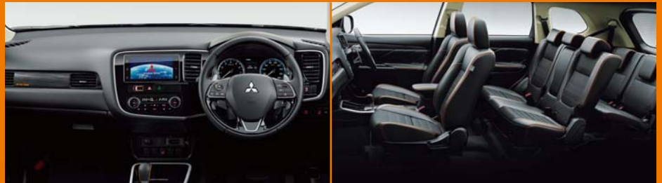
内装色:ブラック ●画面はハメ込み合成 ●撮影のために点灯 ●インテリア写真はカットボディによる撮影