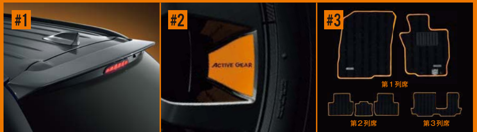
#1 テールゲートスポイラー #2 アルミホイールデカール(ACTIVE GEARロゴ) #3 フロアマット(ブラック&オレンジ) ※三菱自動車 純正用品の保証内容については、営業スタッフにおたずねください。