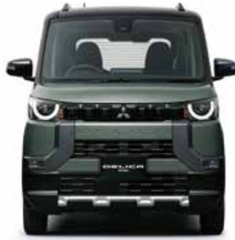
「デリカミニ」オフロード試乗会(当日受付制)