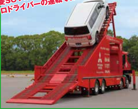
SUV登板キット体験試乗会(当日受付制)

驚異の45度登坂 三菱SUVの実力、走行性、安全性を プロドライバーの運転で体験しよう